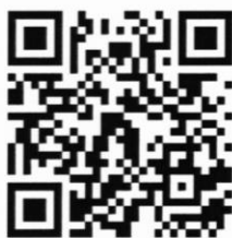
(แบบประเมินหลัง)

๑๐. ขอให้ผู้เข้าสอบทุกคน ทำแบบสอบถามเพื่อประเมินผลการป้องกันการแพร่ระบาดของโรคติดเชื้อไวรัสโคโรนา 2019 (COVID-19) ภายหลังจากเข้ารับการประเมินสมรรถนะ(สอบข้อเขียน) ไปแล้ว โดยให้สแกน QR Code หรือเข้าไปที่ https://forms.gle/H3Hu6jzeDr5AZgT46 โดยสามารถตอบแบบสอบถามได้ตั้งแต่วันที่ ๑๔ - ๑๗ ธันวาคม ๒๕๖๔ เพื่อการติดตามผลและป้องกันการแพร่ระบาดของโรคติดเชื้อไวรัสโคโรนา 2019 (COVID-19)